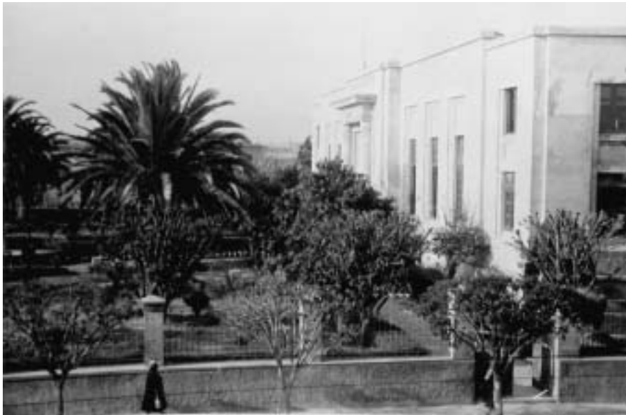
Palacio de Justicia en la ex huerta conventual.

La lucha contra los franciscanos de Tarija y Beni, manejaba mucho la denominación de “extranjeros”. Una interpretación de esto, se puede colegir de la carta que el Concejo Municipal de Tarija escribió el 20 de junio de 1903 al “Señor Vicario Foráneo del Distrito y Párroco de la Iglesia Matriz – Ciudad.” Se le indicaba que debía diferenciarse de las acciones de los sacerdotes del Convento, por ser él, sacerdote nacido en Bolivia; mientras que “los sacerdotes de San Francisco son extranjeros, y poco deben conocer, o poco o importarles, las leyes que rigen entre nosotros; pero de Usted, Señor Vicario, que es un estimable sacerdote, un hombre ilustrado y conocedor de nuestras leyes, en cuyo pecho debe palpitar el sentimiento de la Patria, no es concebible que quisiera oponer resistencia a determinaciones legales”. Las determinaciones aludidas, se referían a la clausura, impuesta por la Alcaldía, de “Los Cepillos”, organización caritativa a favor de los pobres.