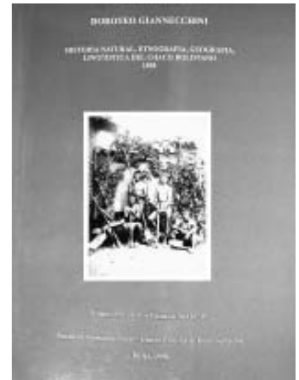
Giannecchini D., Historia, etnografía geográfica, lingüística del Chaco boliviano 1898 , Ed. P. Lorenzo Calzavarini, Sucre, 1996.

No hubo continuidad; ésta se plasmó en un nuevo espíritu apostólico después de la destrucción que separó campos de trabajo, antes unidos. Con la imaginativa “ciudad de Villa Montes”, que destruyó la región reduccional, se siguió con otras secularizaciones: de Aguiarenda (1911); San Francisco y San Antonio del Parapetí (1917). Sud y Norte chaqueños fueron rotos con la misma forma de despojo de tierras, contra los pueblos originarios. La creación del Vicariato del Gran Chaco (Cuevo-Camiri) unía a los restos poblacionales, cambiados ahora en parroquias. Esta última alternativa era