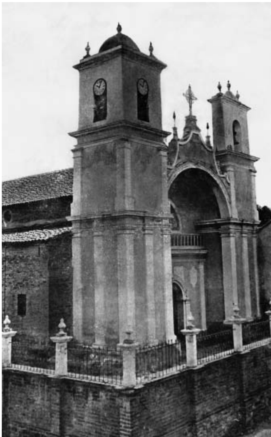
Antigua fachada de la Basílica Menor de San Francisco, Tarija.